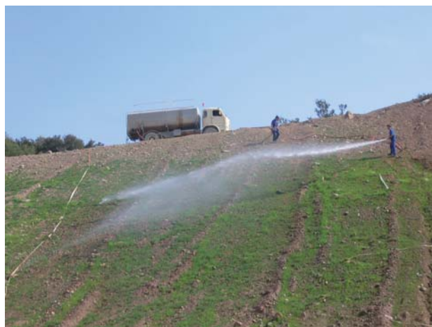
Figura 5.- Riegos de apoyo en las zonas restauradas.

consensuada entre representantes de los distintos actores implicados en la restauración (científicos, técnicos, empresas y administración). Esto permitirá seleccionar las actuaciones más rentables con criterios de economía ecológica. Posiblemente la unificación de criterios respecto a lo que se considera el éxito de una restauración sea el punto más delicado de esta fase.