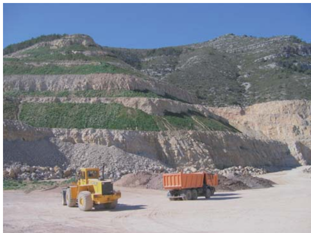
Figura 2.- Vista de las zonas restauradas (izquierda de las fotos) en “la Martinenca” en marzo del 2006 (fotografía de la izquierda) y en junio del 2006 (fotografía de la derecha).