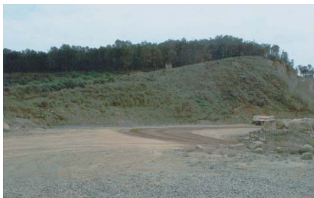
Figura 5.- Zona sembrada con una antigüedad de 5 años (foto superior izquierda). Zona tratada con lodos de depuradora con una antigüedad de 3 años (foto superior derecha). Plantación de pino carrasco de 12 años de antigüedad (foto inferior izquierda). Zonas tratadas con lodos de depuradora entre 3-8 años de antigüedad (foto inferior derecha).

Respecto a la siembra de herbáceas, se pretende ensayar diferentes composiciones. El objetivo es conocer si estas distintas mezclas presentan desarrollos contrastados y saber como evolucionan en el tiempo y en sustratos diferentes. Algunas de estas mezclas contienen especies herbáceas propias de formaciones forestales en contraposición con otras mezclas estrictamente comerciales. También se pretende conocer si existe interacción entre alguna de estas mezclas herbáceas y los arbustos introducidos.