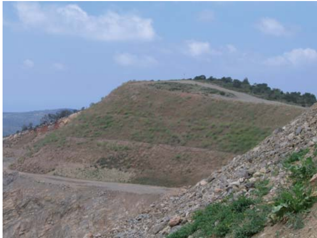
Figura 3.- Morfologías finales de los taludes de restauración.