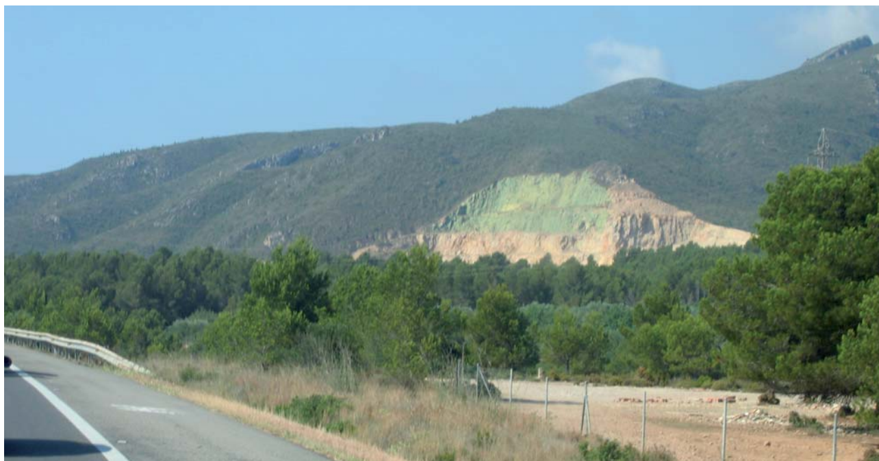
Figura 1.- Actuación de integración paisajística mediante pintado de los frentes de una cantera de Tarragona (Cataluña).

La demanda de rapidez supera a la demanda de calidad y la colocación de tierras y las siembras con mezclas herbáceas de rápido crecimiento siguen siendo las actuaciones más